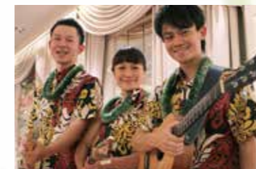
Alohana Quartette アロハナ カルテット