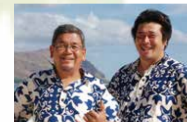
Kolonahē / コロナヘ

ご協力頂きました各教室の先生方、生徒のみなさま、ミュージシャンのみなさま、ご来店頂きましたお店のみなさま、協賛、後援、ご協力頂いた各企業様、お手伝いいただいたスタッフのみなさん、ほんとうにありがとうございました。ご協力ありがとうございました。実行委員会一同